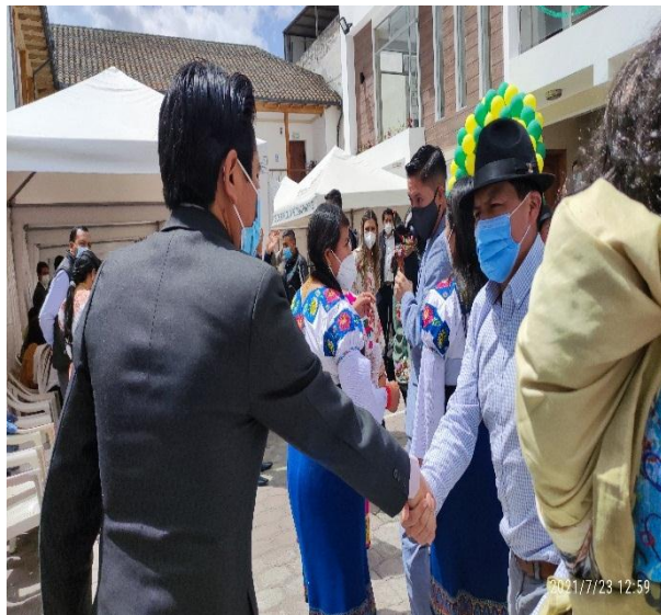
RECONOCIMIENTO POR PARTE DE UNOPAC

SESIÓN SOLEMNE CANTONIZACIÓN 23 DE JULIO DE 2022