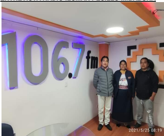
ENTREVISTA RADIO ILUMAN PESILLO IMBABURA