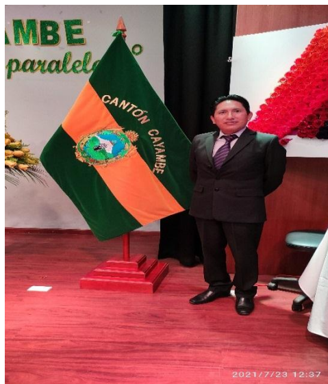
LEGALIZACIÓN BARRIO SAN MANUEL